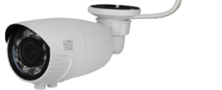
Рис. 1 Схема подключения видеокмеры