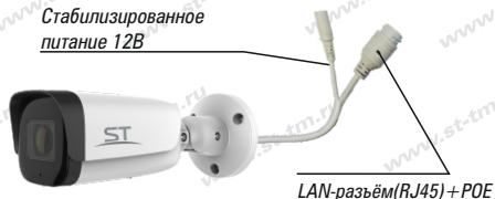
Рис.1 Схема подключения видеокмеры