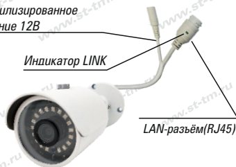
Рис. 1 Схема подключения видекамеры